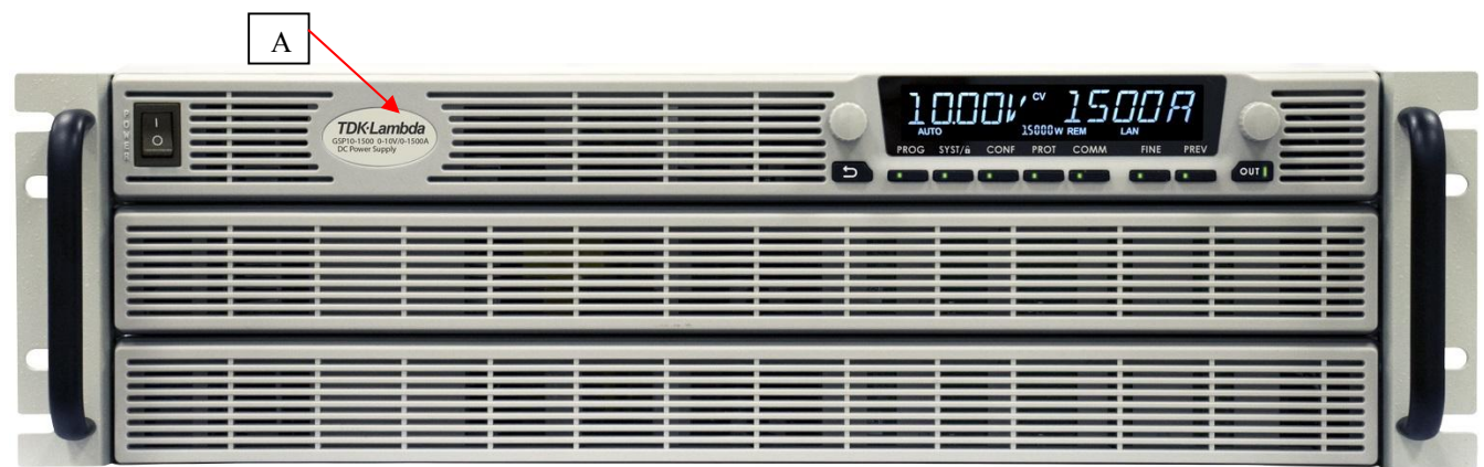
Модификации GSP10-1500, GSP20-750, GSP30-510, GSP40-375, GSP60-255, GSP80-195, GSP100-150, GSP150-102, GSP300-51, GSP600-25.5