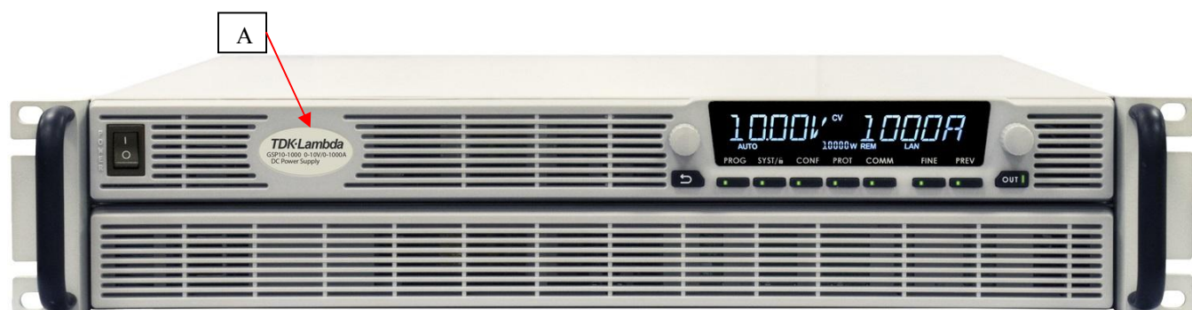
Модификации GSP10-1000, GSP20-500, GSP30-340, GSP40-250, GSP60-170, GSP80-130, GSP100-100, GSP150-68, GSP300-34, GSP600-17