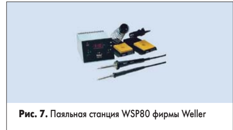
Рис. 7. Паяльная станция WSP80 фирмы Weller

от различных производителей. Мы остановились на антистатической паяльной станции WSP80 от фирмы Weller (№ 332-0379, рис. 7) как наиболее универсальной и отвечающей всем современным требованиям, предъявляемым к подобному оборудованию. Она комплектуется двумя паяльниками WSP80 и двумя держателями WPH80, совместима со всеми регулируемыми инструментами «Temtronic» мощностью до 80 Вт на канал: с паяльным пинцетом DS80, паяльником с вакуумным отсосом WS80, нагреваемым столиком W-HPS, микропаяльниками MLR21или MPR30 или обычными паяльниками LR81, L R21.