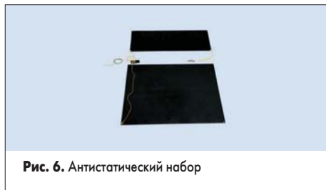
Рис. 6. Антистатический набор

Антистатический набор (рис. 6), в который входят регулируемые антистатические браслеты, витой шнур, соединительные провода 2×120 см, и который поставляется вместе с коннекторами и межсоединительной платой с фиксированными отверстиями, — неотъемлемая часть рабочего места инженера-монтажника (№ 539-974).