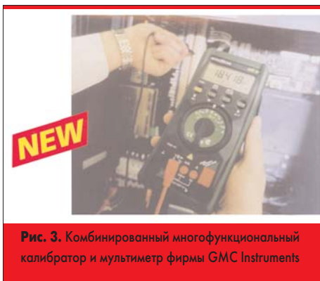
Рис. 3. Комбинированный многофункциональный калибратор и мультиметр фирмы GMC Instruments