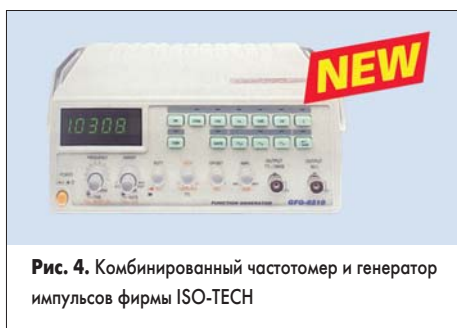
Рис. 4. Комбинированный частотомер и генератор импульсов фирмы ISO-TECH