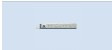
Рис. 9. Сетевые удлинители с защитой по остаточному току

Для версии с выключателем сети — двухполюсный выключатель сети на 16 А с подсветкой.