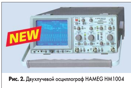
Рис. 2. Двухлучевой осциллограф HAMEG HM1004