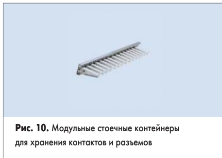
Рис. 10. Модульные стоечные контейнеры для хранения контактов и разъемов

Такие планки (№ 509-399, рис. 10) легко крепятся на любую вертикальную поверхность и позволяют удобно хранить тестовые выводы и другие аксессуары для кабелей. Имеют алюминиевые направляющие (в комплект входят монтажные винты) и 15 литых крючков, которые фиксируются на направляющих в любом положении. Расстояние между центрами крепления направляющих — 330,5 мм.