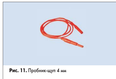
Рис. 11. Пробник-щуп 4 мм

Щуп длиной 1 м, с двойной ПВХ-изоляцией, на максимальное напряжение 150 В, категории II (CAT II), 19 А (№ 248-7724, рис. 11).