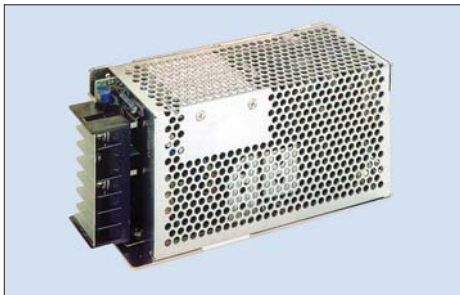
Рис. 5. Источник питания фирмы Lambda, серия JWS-P