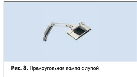
Рис. 8. Прямоугольная лампа с лупой

Часто требуется не просто осветить рабочее место, но и использовать увеличение. RS рекомендует использовать лампы, которые дополнены лупой (№ 356-2129, рис. 8).